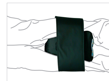
EN POSITION LATÉRALE LORS DES SOINS