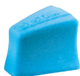
Coussin d'abduction de hanches