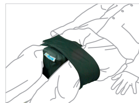
EN DÉCUBITUS DORSAL