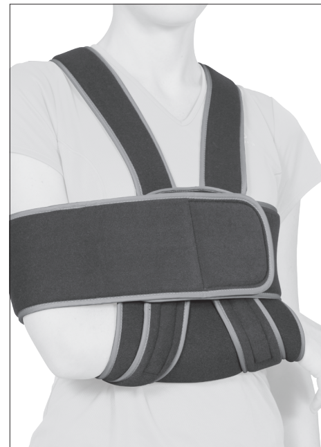
BANDAGE D'IMMOBILISATION D'ÉPAULE

NOT_BandageImmobilisationEpaule_150529_V3