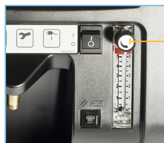
Molette de réglage